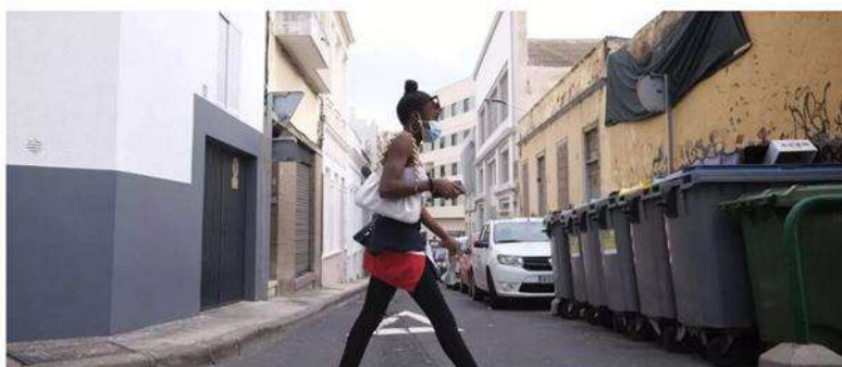
Barrio de El Toscal, en Santa Cruz de Tenerife.